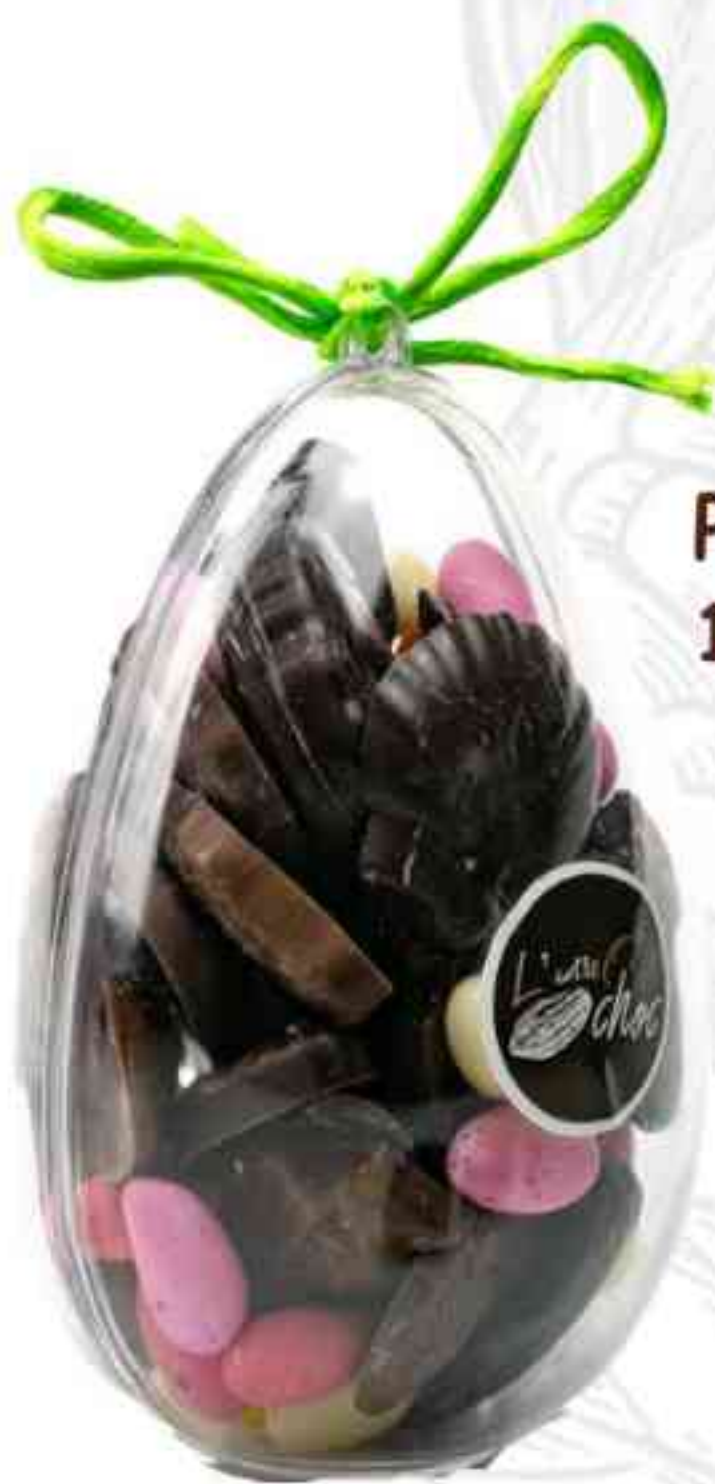
PLEXI'ŒUF 140g - 12€