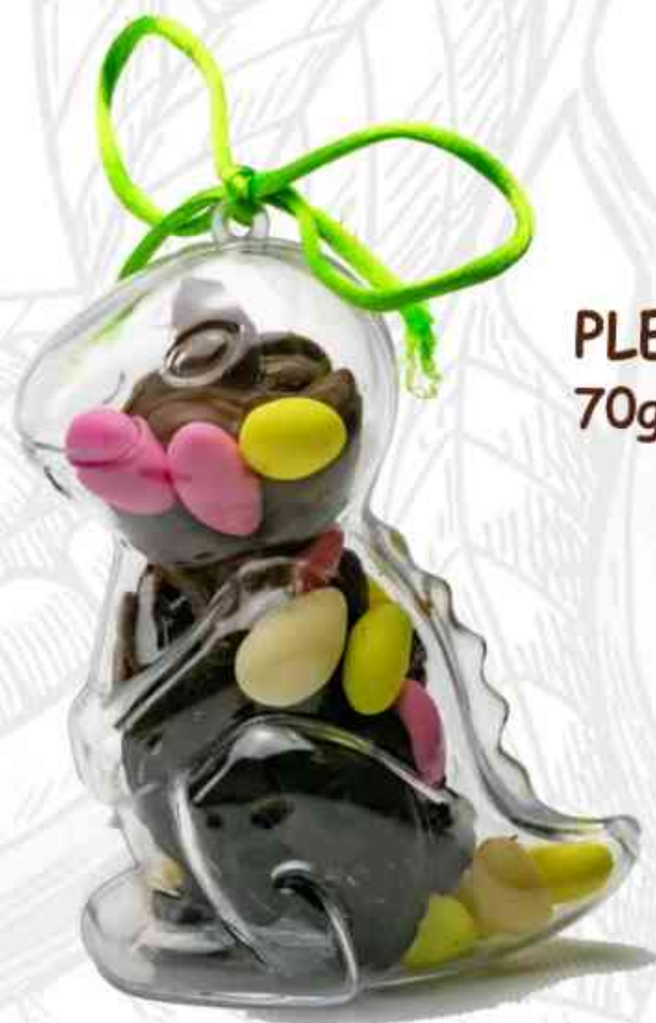
PLEXI'DINO 70g - 7€