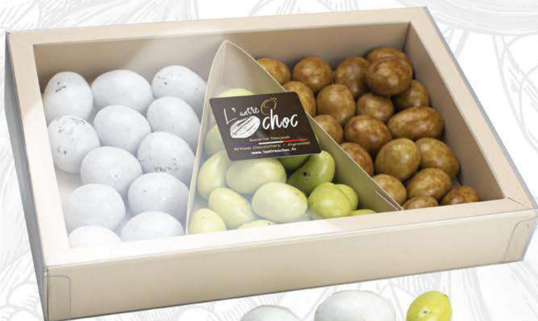
BOÎTE TRIO ŒUFS Œufs nougat, noisette et amande 300g - 16,5€